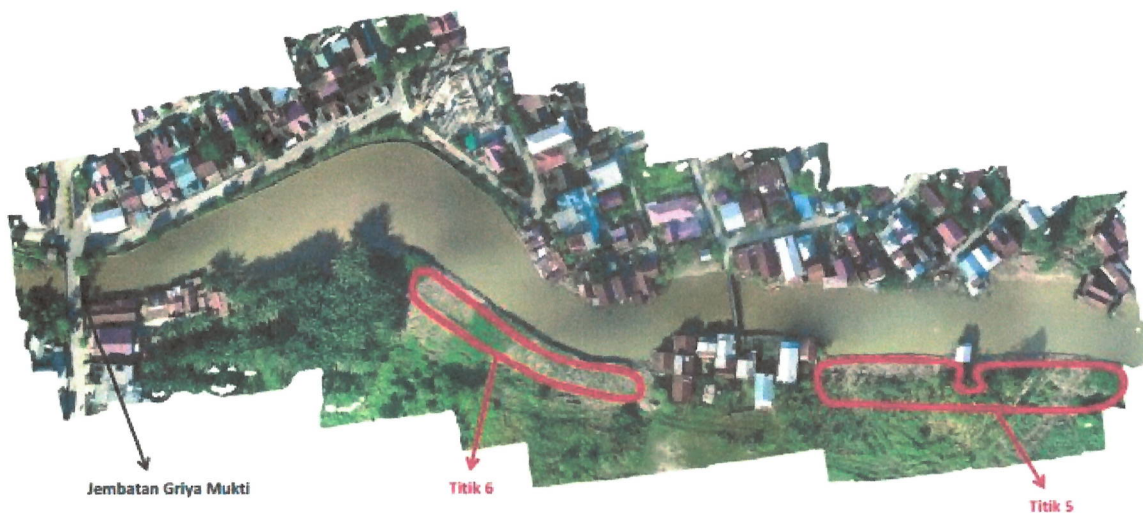
Gambar 3. Peta lokasi penanaman di sempadan SKM pada segmen Jembatan Gelatik-Jembatan PM. Noor (a, b, c, dan d)