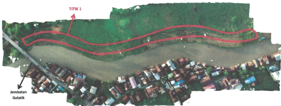
Segmen Jembatan Gelatik - Jembatan PM. Noor (P = 2.323,10 m)

Total panjang sempadan dari ke 3 segmen adalah 5.037,20 meter dengan 8 titik lokasi penanaman. Peta lokasi penghijauan disajikan pada Gambar 3 (a, b, c dan d), 4, dan 5 berikut ini.